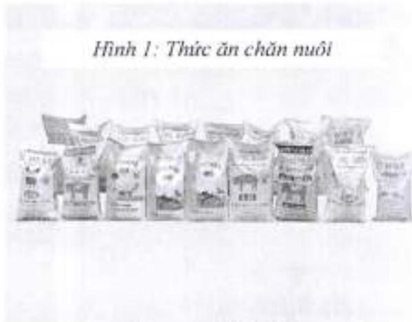
Hình 1: Thức ăn chăn nuôi

Với năng lực kho chứa: 22.000 tấn cho kho nguyên liệu, 1.000 tấn cho kho thành phẩm. Công suất thiết kế 100.000 tấn/ năm bao gồm 04 dây chuyền sản xuất theo công nghệ Hà Lan, Mỹ, Đài Loan. Hiện nay, Công ty đã cung cấp ra thị trường 53 loại sản phẩm khác nhau với các loại thức ăn ở dạng bột, cấn mảnh, viên, viên nổi cho chăn nuôi gia súc, gia cầm và thủy sản. Trong đó, thức ăn cho thủy sản là thế mạnh của thức ăn chăn nuôi, hiện các sản phẩm dành cho cá có vây, cá lóc, cá kèo, cá trê vàng đang là những sản phẩm chiến lược được ưa chuộng trên thị trường.