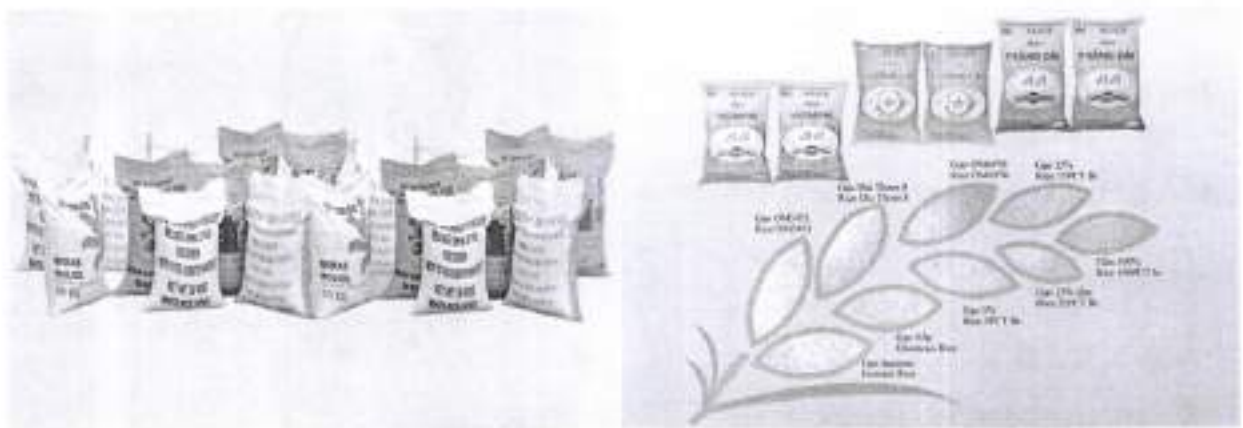
Hình 2: Lương thực xuất khẩu

Trong những năm qua, AFIEX đã không ngừng nâng cao năng lực chế biến gạo để cung cấp cho các loại gạo trắng xuất khẩu: 5%, 10%, 15%, 25% tấm, gạo thơm, gạo cao cấp, cho các thị trường Châu Á, Châu Phi, Trung Đông... Năng lực kho chứa (gạo) 80.000 tấn, công suất chế biến xát trắng và lau bóng gạo 200.000 tấn/năm, tách hạt khác màu 40.000 tấn/năm, sấy lúa công nghiệp 50.000 tấn/năm, xay xát lúa 36.000 tấn/năm.