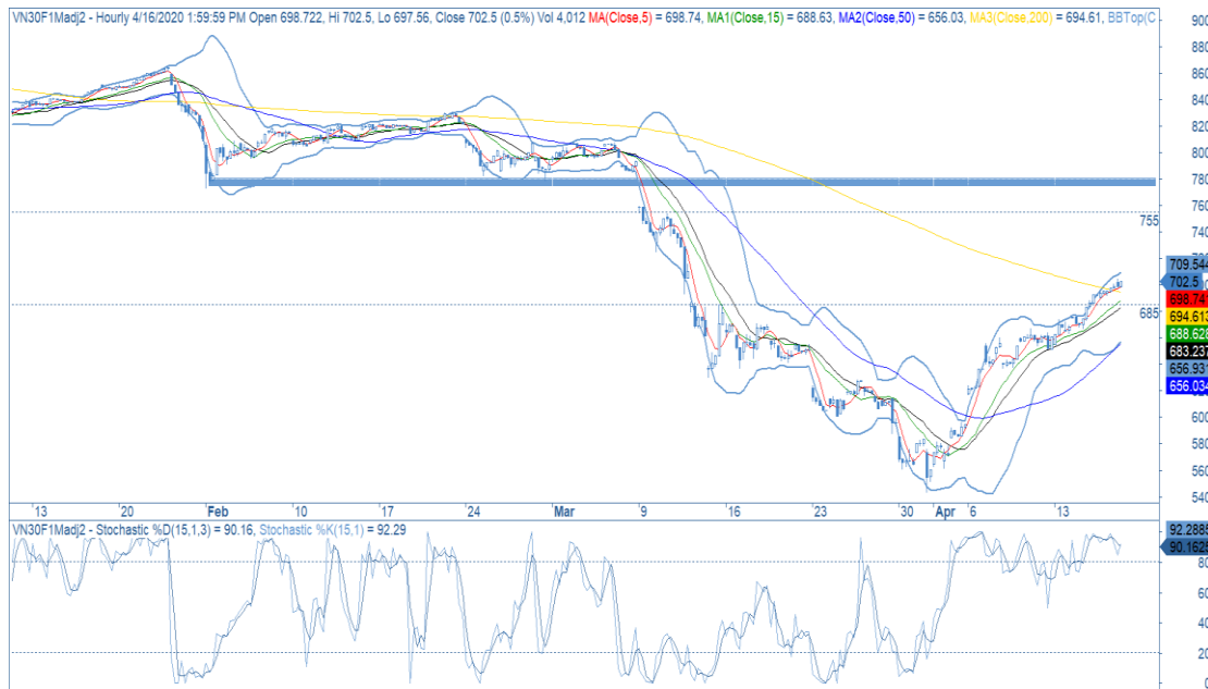
Đồ thị nến theo giờ

Created with AmiBroker - advanced charting and technical analysis software. http://www.amibroker.com