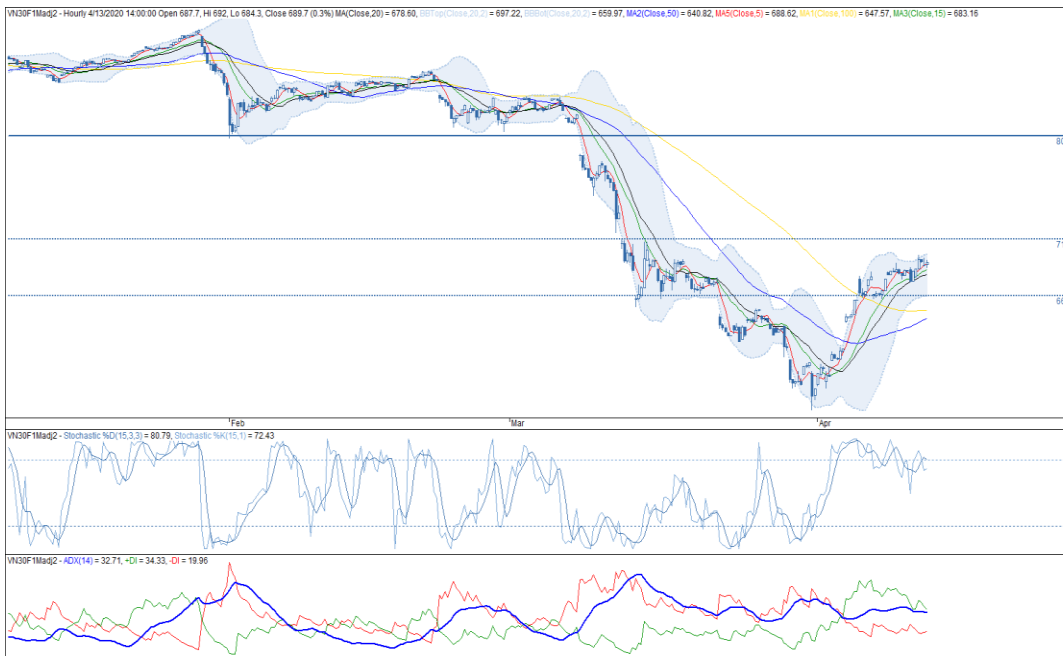
Đồ thị nến theo giờ

*Điều chỉnh giá theo PP Proportional Adjustment