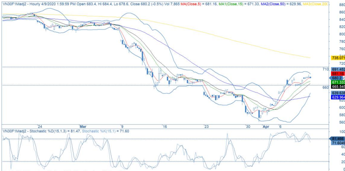
Đồ thị nến theo giờ

Created with AmiBroker - advanced charting and technical analysis software. http://www.amibroker.com