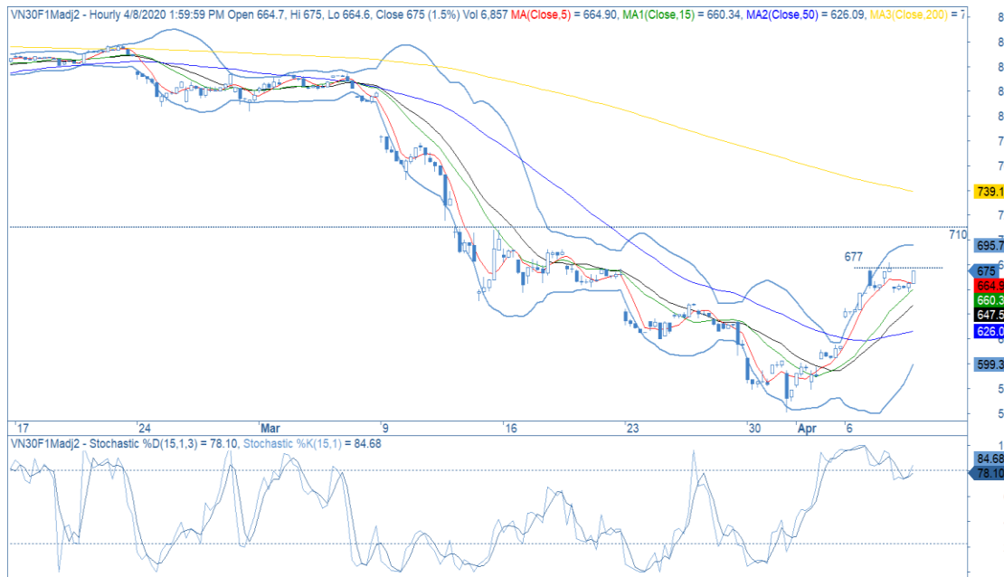
Đồ thị nến theo giờ

Created with AmiBroker - advanced charting and technical analysis software. http://www.amibroker.com