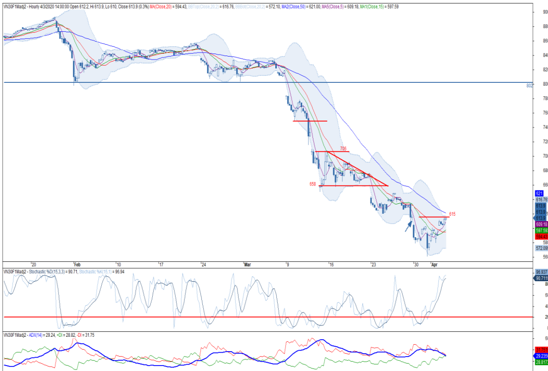
Đồ thị nền theo giờ

*Điều chỉnh giá theo PP Proportional Adjustment Nguồn: Fiinpro, KIS