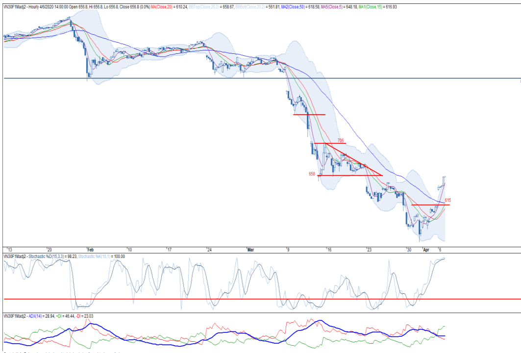
Đồ thị nến theo giờ

*Điều chỉnh giá theo PP Proportional Adjustment