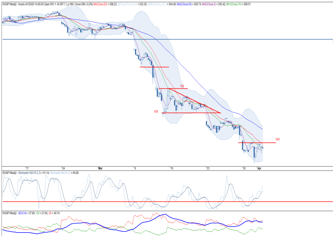
Đồ thị nến theo giờ

*Điều chỉnh giá theo PP Proportional Adjustment Nguồn: Finpro, KIS