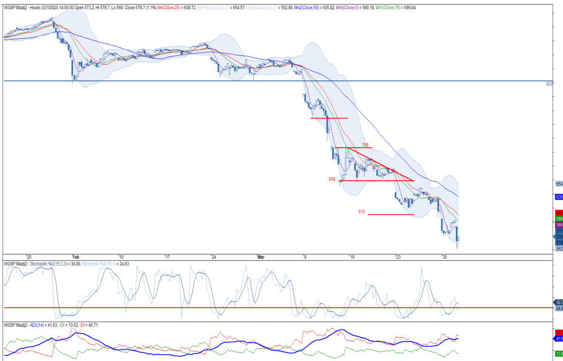
Đồ thị nến theo giờ

*Điều chỉnh giá theo PP Proportional Adjustment