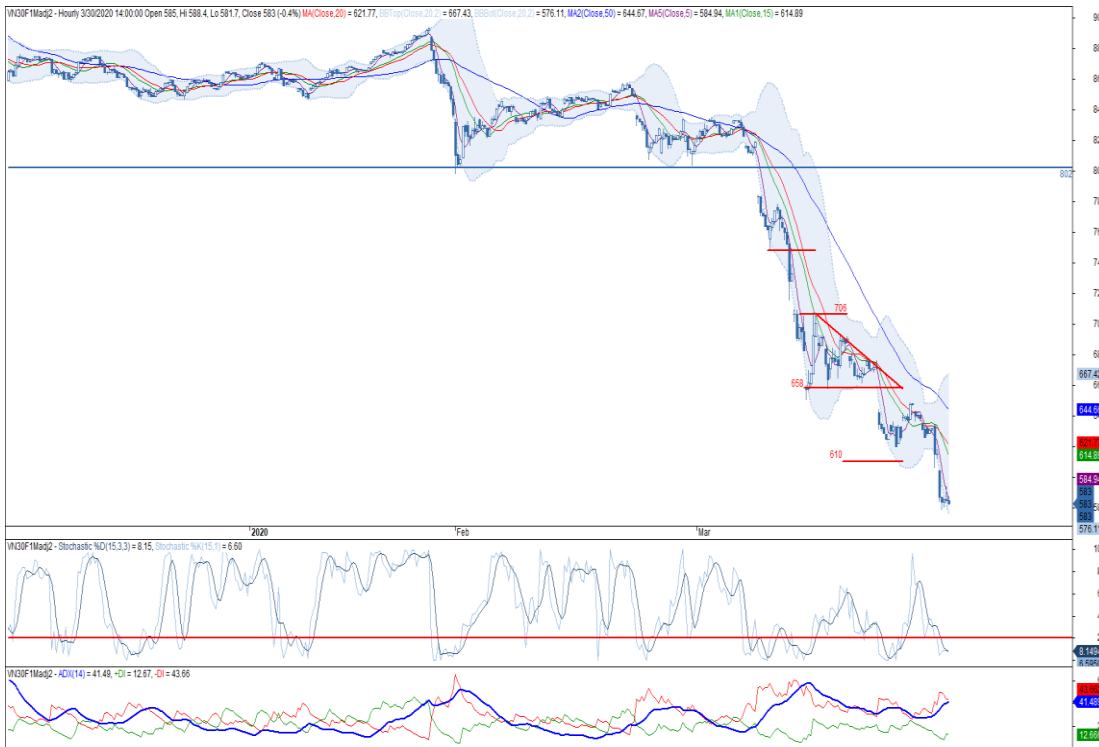
Đồ thị nến theo giờ

*Điều chỉnh giá theo PP Proportional Adjustment