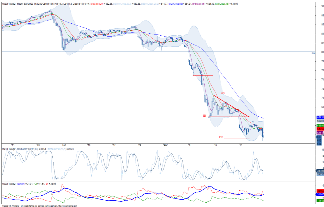
Đồ thị nến theo giờ

*Điều chỉnh giá theo PP Proportional Adjustment