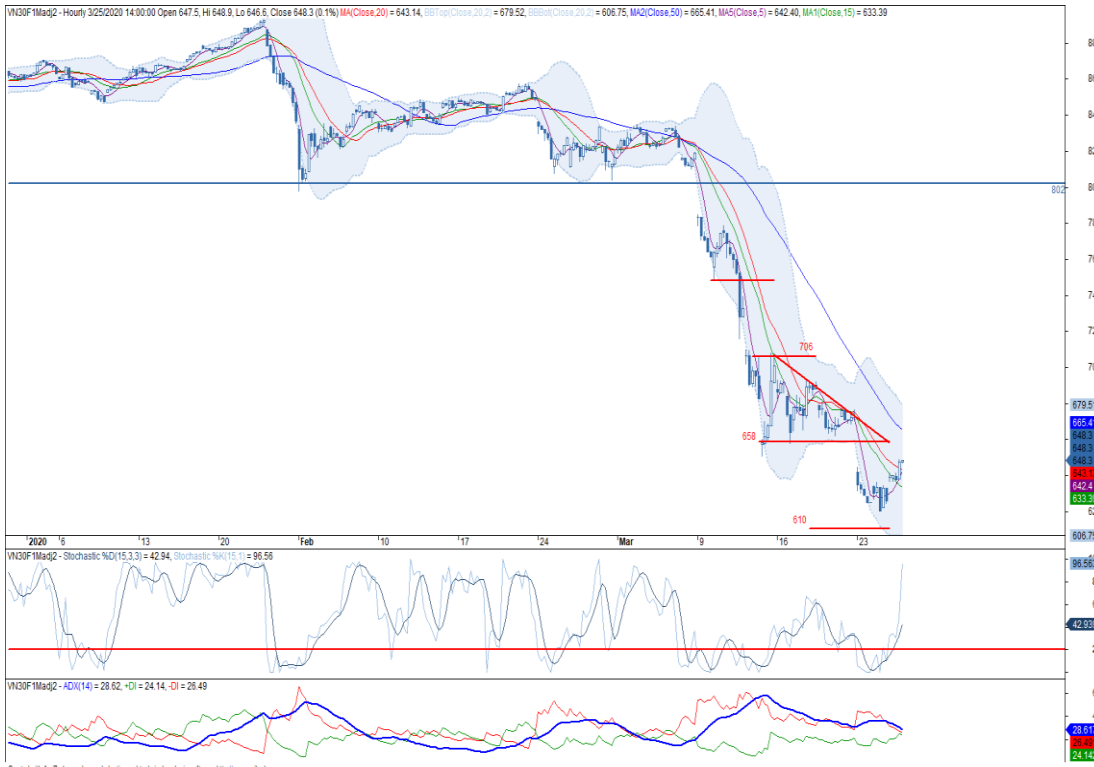
Đồ thị nến theo giờ

Chiến lược đầu tư: Mua VN30F2004 tại 660 điểm khi breakout xuất hiện tại ngưỡng 658 điểm, mục tiêu tại 706 điểm và dừng lỗ tại 648 điểm.