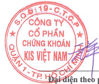
Đại diện theo pháp luật PARK WON SANG