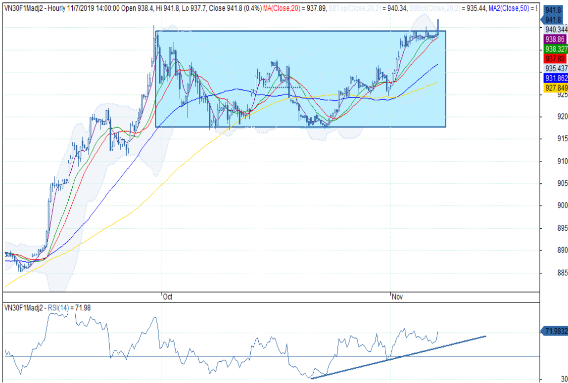
Đồ thị nền theo giờ

*Điều chỉnh giá theo PP Proportional Adjustment Nguồn: Fiinpro, KIS