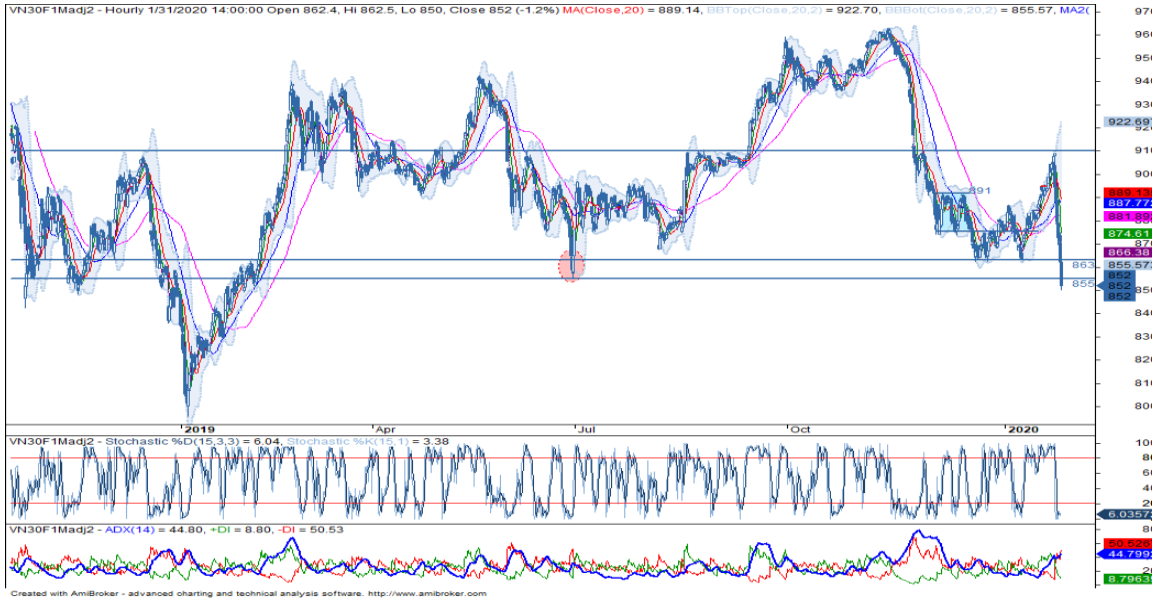
Đồ thị nến theo giờ

*Điều chỉnh giá theo PP Proportional Adjustment Nguồn: Fiinpro, KIS