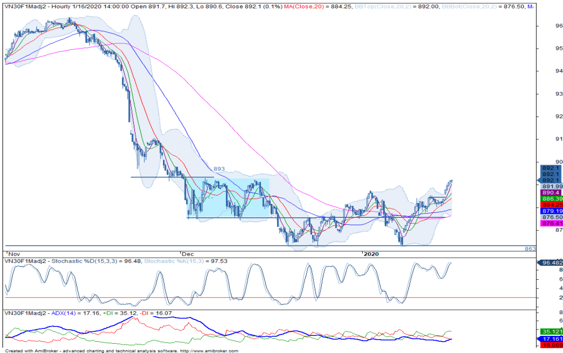
Đồ thị nến theo giờ

*Điều chỉnh giá theo PP Proportional Adjustment