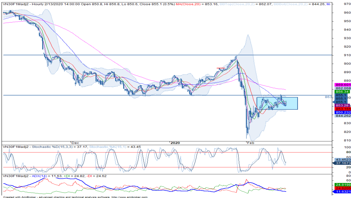
Đồ thị nền theo giờ

Chiến lược đầu tư: Mua VN30F2002 tại vùng 860-863 điểm trên giai đoạn pullback sau khi breakout xuất hiện tại 863 điểm, mục tiêu là 875 điểm và dừng lỗ tại 855 điểm.