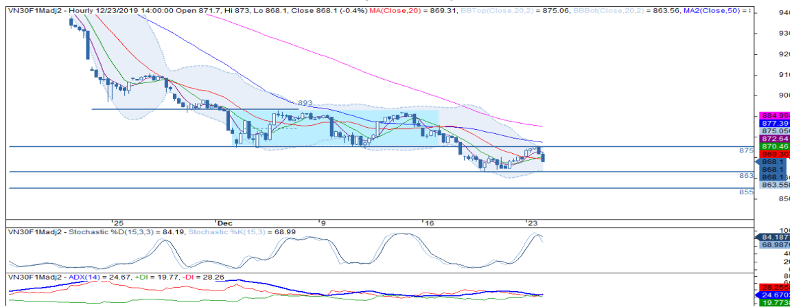
Đồ thị nền theo giờ

Chiến lược đầu tư: Bán VN30F2001 ở mức 862 điểm khi mức 863 điểm bị phá vỡ, chốt lời ở mức 855 và dừng lỗ ở mức 867 điểm.