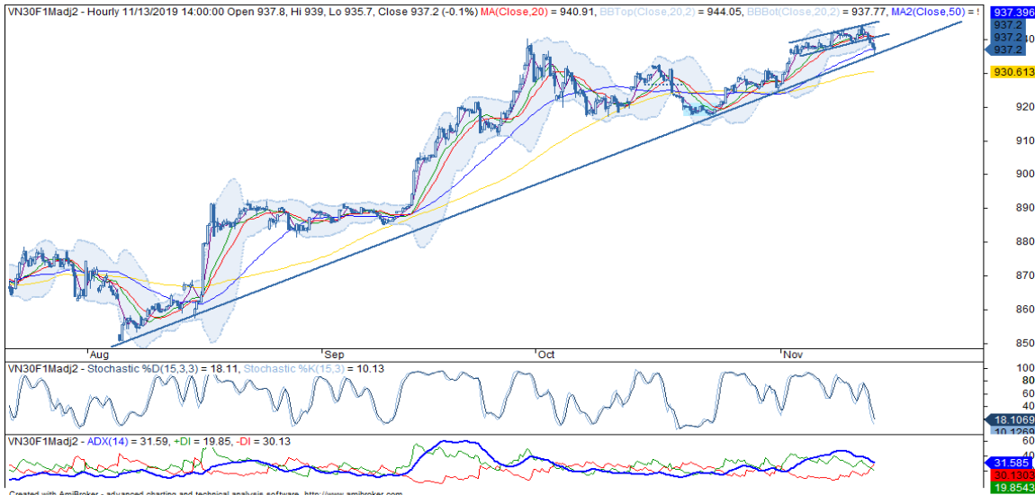
Đồ thị nền theo giờ

*Điều chỉnh giá theo PP Proportional Adjustment Nguồn: Fiipro, KIS